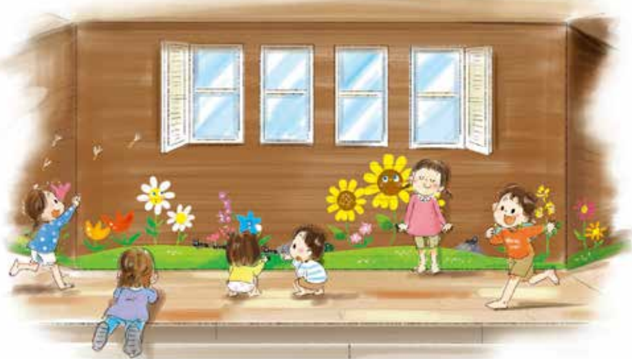
イメージデザインスケッチ