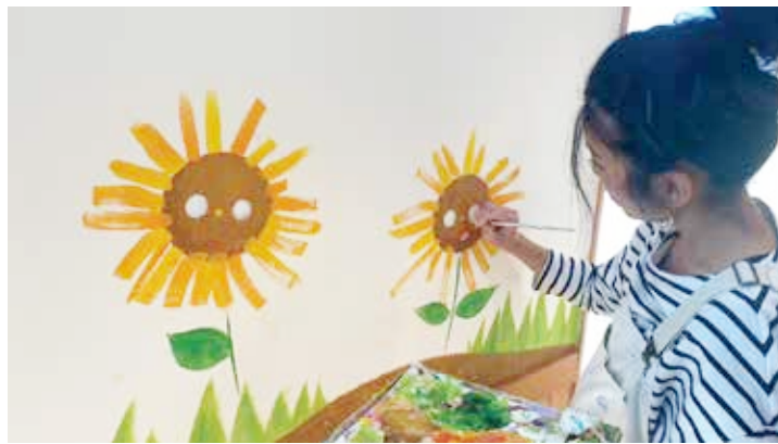
▲ こどもの色や形を活かしてプロのアーティストがまとめる。