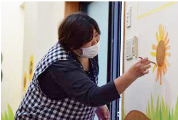
▲ 先生も参加。こどもたちに見守られながら応援もされて。