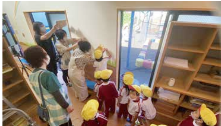
▲ 描かれる工程はプロモーションや保育カリキュラムに活用する。