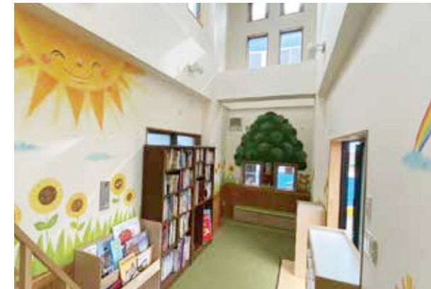
▲ 完全オリジナルの空間が完成する。