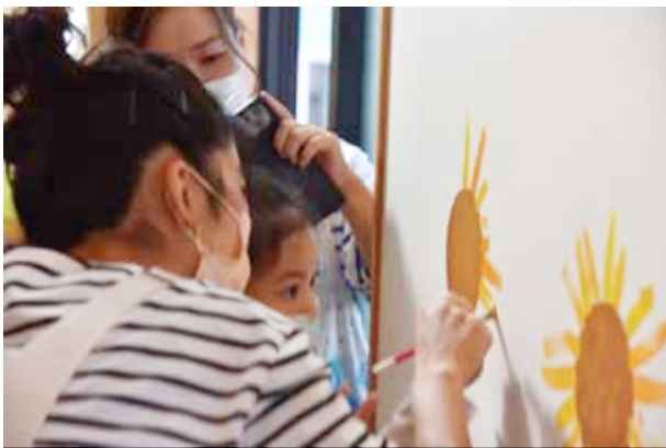
▲ 花びらを一筆ずつ描く。こどもならではの花ができる。